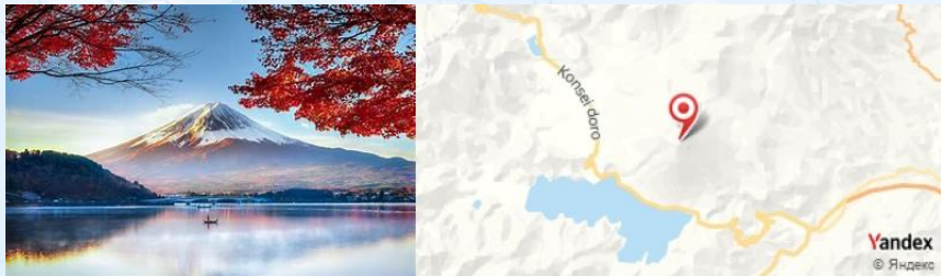
Mount Fuji, Japan

Après le petit déjeuner à votre hôtel, partez pour le Mont Fuji . Arrivée pour faire une randonnée sur l'un des sentiers les plus accessibles, comme le Sentier Hakone , qui offre des vues magnifiques sur le lac Ashi.