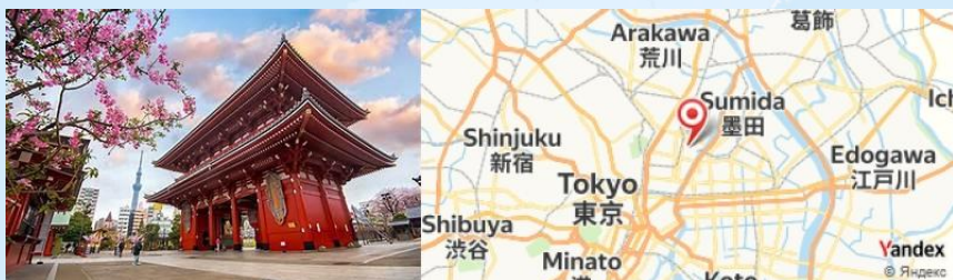
Senso-ji Temple, Tokyo, Japan

Après cela, promenez-vous dans le quartier historique voisin de Asakusa , où vous pourrez visiter le Senso-ji , le temple le plus ancien de Tokyo. Flânez dans la rue commerçante Nakamise pour découvrir des souvenirs et goûter aux spécialités locales comme les melon pan et dorayaki.