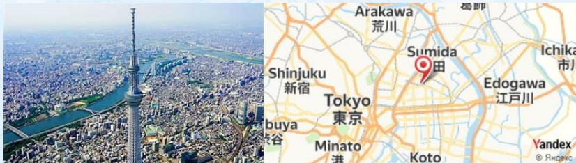
Tokyo Skytree, Tokyo, Japan

Commencez votre journée par une visite au Tokyo Skytree , l'une des plus hautes structures du monde. Montez au sommet pour une vue panoramique époustouflante de la ville et, par temps clair, apercevez le Mont Fuji au loin.