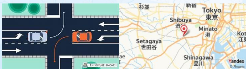
Shibuya Crossing, Tokyo, Japan

Terminez la journée avec une promenade à Shibuya , où vous pourrez voir le célèbre croisement de Shibuya, prendre des photos et vous imprégner de l'atmosphère vibrante. Pour un dessert, essayez le parfait au thé vert au café Kawaii Monster Café .