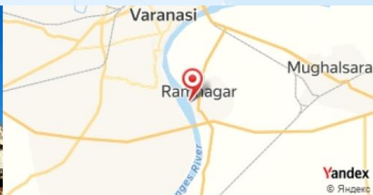
Ramnagar Fort, Varanasi, India