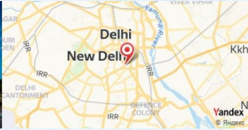
India Gate, New Delhi, India