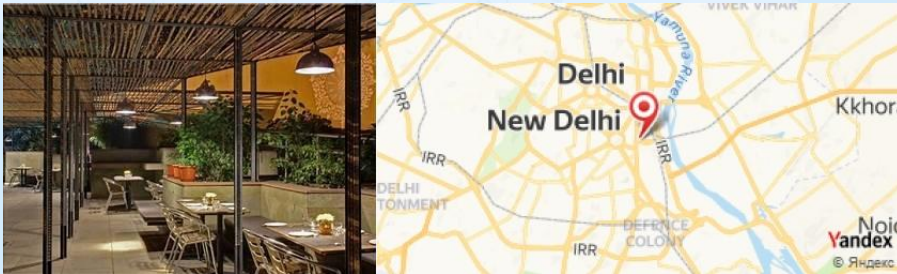
Cafe Lota, New Delhi, India

- Déjeuner au Cafe Lota , qui propose une cuisine indienne contemporaine. Essayez le Biryani de légumes .