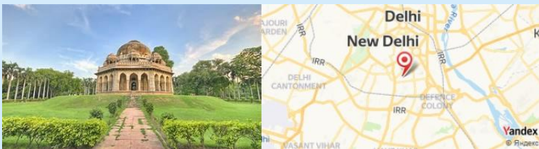
Lodi Gardens, New Delhi, India

- Après le déjeuner, balade au Lodhi Gardens , un parc historique idéal pour une promenade relaxante entourée de monuments et de verdure.