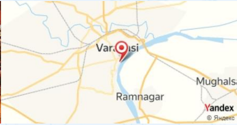
Ganga Aarti, Varanasi, India