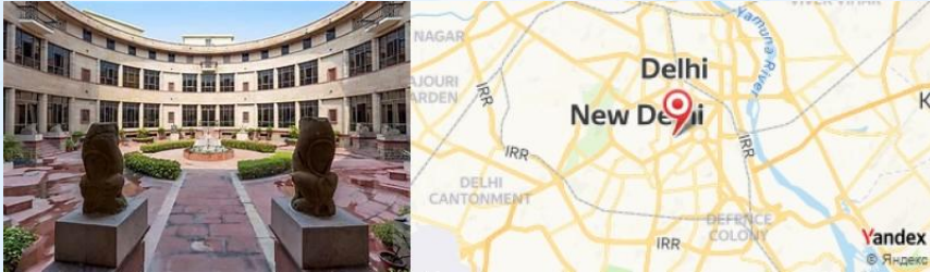
National Museum, New Delhi, India

- Visite du National Museum , où vous pouvez explorer l'histoire de l'Inde à travers ses expositions culturelles.