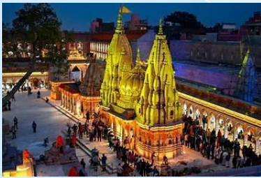
Kashi Vishwanath Temple, Varanasi, India

- Visite de la Kashi Vishwanath Temple , l'un des temples les plus sacrés de l'hindouisme, réputé pour son architecture.