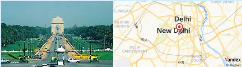
Rajpath, New Delhi, India