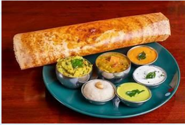
Dosa Cafe, Varanasi, India

- Petit-déjeuner au Dosa Cafe , célèbre pour ses délicieuses crêpes indiennes. Ne manquez pas le Dosa au fromage .