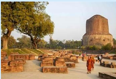
Sarnath, Varanasi, India