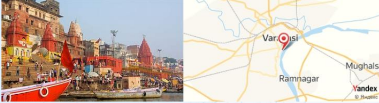
Dasaswamedh Ghat, Varanasi, India