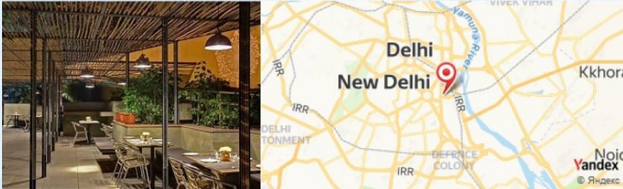
Café Lota, New Delhi, India

- Pause café au Café Lota , un endroit cosy qui propose des plats inspirés des cuisines régionales. Essayez le Masala Chai avec des snacks indiens comme le Methi Malai Murg .