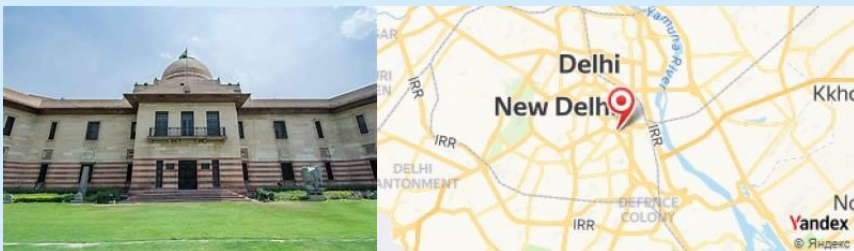
National Gallery of Modern Art, New Delhi, India

- Visite de la Galerie Nationale d'Art Moderne pour apprécier l'art contemporain indien.