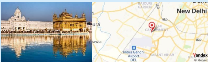
Punjab, New Delhi, India

- Spectacle de danse traditionnelle au Punjab pour finir la soirée en beauté.