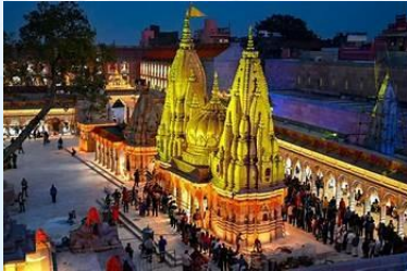
Kashi Vishwanath Temple, Varanasi, India