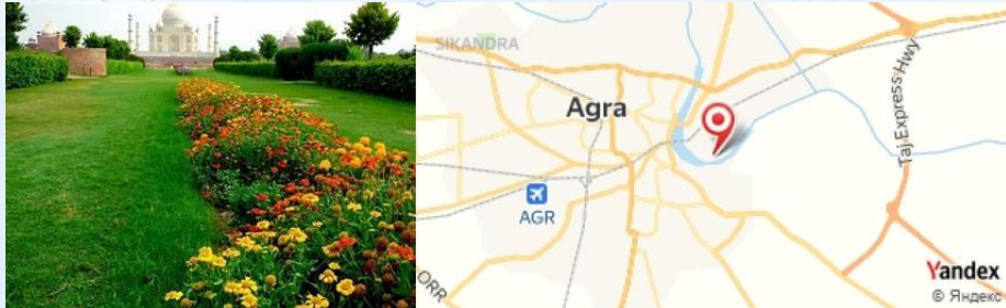
Mehtab Bagh, Agra, India