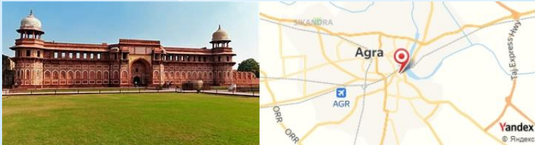
Agra Fort, Agra, India