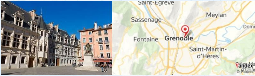
Place Saint André, Grenoble, France

Après le dîner, assistez à un spectacle en plein air à la Place Saint André si disponible, pour profiter de l'animation de la ville.