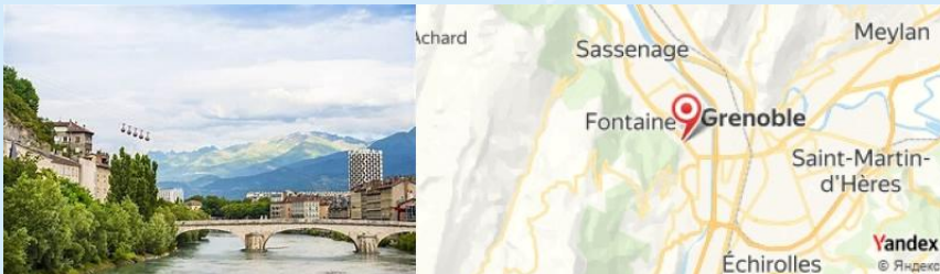
Restaurant Le Vercors, Grenoble, France

Déjeunez au Restaurant Le Vercors , qui propose des plats savoureux préparés avec des produits locaux. Ne manquez pas de goûter la fondue savoyarde , un plat typique de la région.