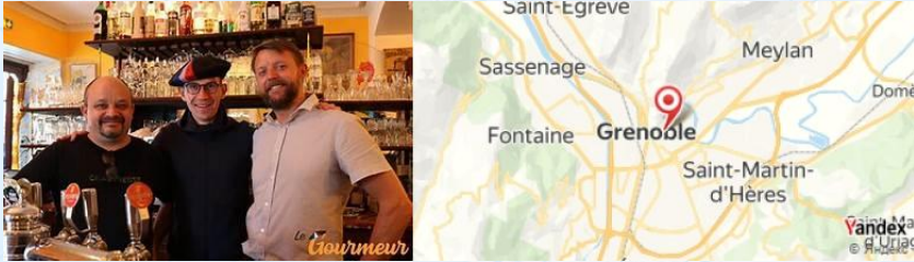
Café de la Table Ronde, Grenoble, France

Commencez votre journée avec un petit déjeuner au Café de la Table Ronde , un café historique où vous pourrez déguster un croissant frais et un café. Essayez la spécialité locale, le pain au chocolat .