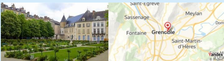
Jardin de Ville, Grenoble, France

Après le déjeuner, promenez-vous dans le Jardin de Ville , un parc charmant au coeur de Grenoble. Profitez de l'ombre des arbres, laissez les enfants jouer ou reposez-vous sur un banc.