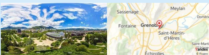
Parc Paul Mistral, Grenoble, France

Dans l'après-midi, découvrez le Parc Paul Mistral , un vaste espace vert idéal pour se détendre. Profitez des jardins, des aires de jeux et d'une promenade au bord du lac.