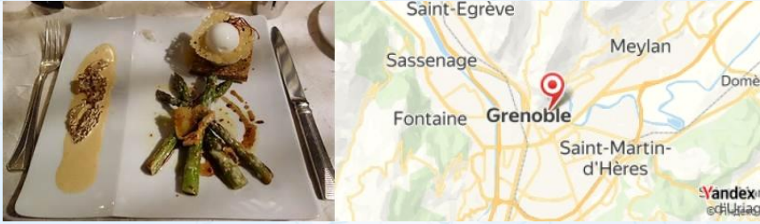
L'Escalier, Grenoble, France

Pour le dîner, essayez L'Escalier , qui propose une cuisine moderne et inventive. Ne manquez pas leur magret de canard en sauce.