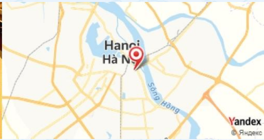
Green Tangerine, Hanoi, Vietnam

Assistez à un spectacle de marionnettes sur l'eau, une tradition vietnamienne, au Théâtre de marionnettes sur l'eau de Hanoi .