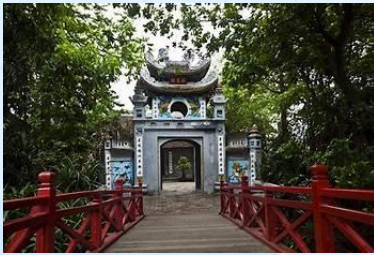
Ngoc Son Temple, Hanoi, Vietnam

Promenez-vous autour du Lac Hoan Kiem et visitez le Temple Ngoc Son , un bel exemple de l'architecture vietnamienne.