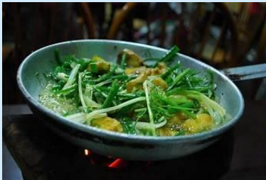
Cha Ca La Vong, Hanoi, Vietnam

Déjeuner au restaurant Cha Ca La Vong , célèbre pour son plat signature, le Cha Ca (poisson grillé mariné).