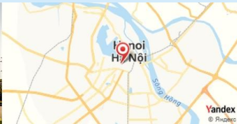
Ho Chi Minh Mausoleum, Hanoi, Vietnam

Explorez le Musée d'Ethnologie pour découvrir les différentes cultures ethniques du Vietnam.