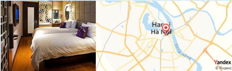
Lan Ong, Hanoi, Vietnam

Retour à Hanoï. Dîner au Lan Ong , où vous pourrez déguster un plat de bun cha , des nouilles de riz avec du porc grillé.