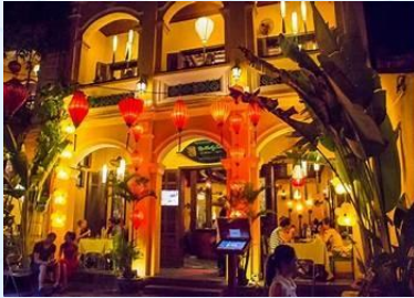
Morning Glory, Hoi An, Vietnam

Déjeuner au Morning Glory , où vous pouvez essayer des plats comme le cao lau (nouilles typiques de Hoi An).