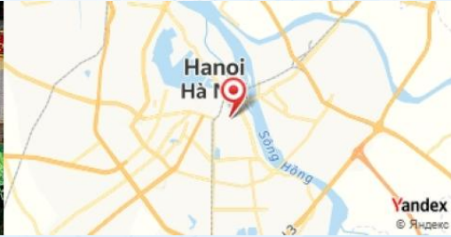
Water Puppet Theatre, Hanoi, Vietnam