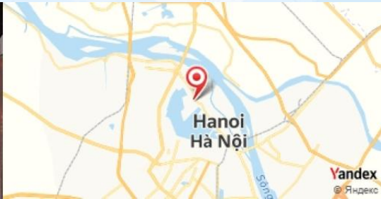
Bobby Chinn, Hanoi, Vietnam

Profitez d'une promenade nocturne autour du lac pour admirer l'illuminations des bâtiments.