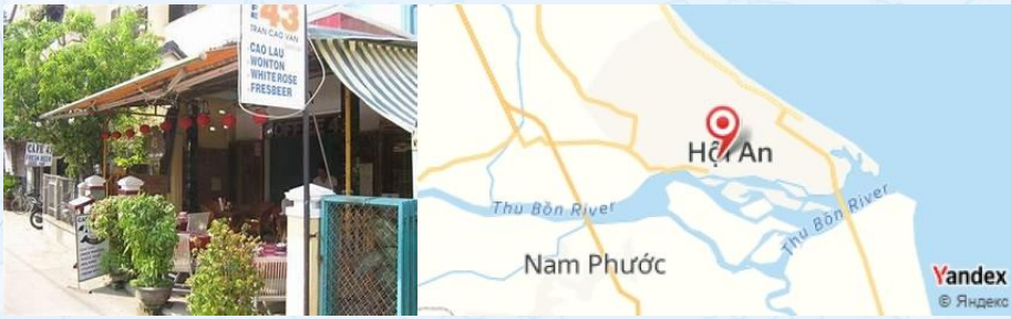
Cafe 43, Hoi An, Vietnam

Profitez d'un massage relaxant dans un spa local pour conclure la journée en douceur.