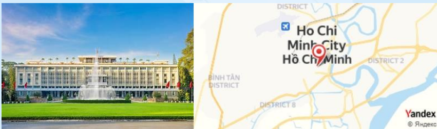
Reunification Palace, Ho Chi Minh City, Vietnam

Retour en ville pour une visite au Palais de la Réunification , symbole de la fin de la guerre.