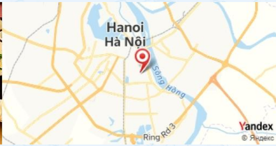
Nha Hang Ngon, Hanoi, Vietnam

Balade dans le quartier français pour admirer l'architecture coloniale et visiter la Cathédrale Saint-Joseph . St. Joseph Cathedral, Hanoi, Vietnam