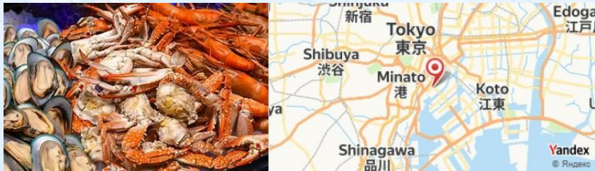
Tsukiji Outer Market, Tokyo, Japan

- Commencez votre journée au marché de Tsukiji, célèbre pour ses fruits de mer frais. Profitez d'un petit déjeuner léger avec des sushis ou des sashimis au petit comptoir