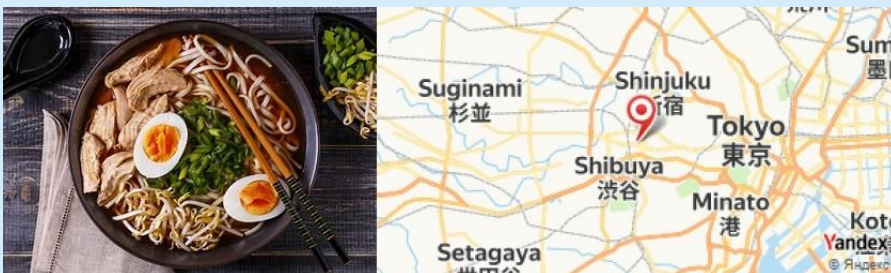
Ramen Nagi, Tokyo, Japan

- Retournez à Tokyo et terminez votre journée par un repas léger au "Ramen Nagi", connu pour ses ramens savoureux dans un cadre convivial