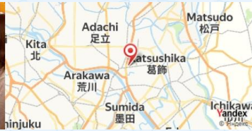
Torikizoku, Tokyo, Japan