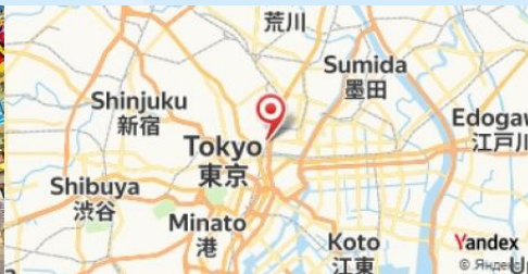
Akihabara, Tokyo, Japan