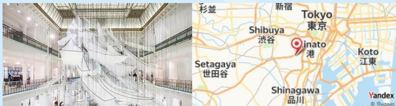
Mori Art Museum, Tokyo, Japan

- Explorez le quartier de Roppongi et montez au Mori Art Museum pour découvrir des expositions d'art contemporain