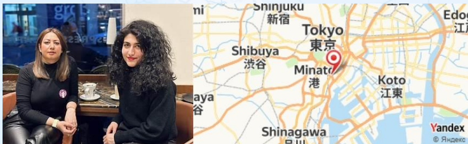
Café de L'ambre, Tokyo, Japan

- Prenez un café au "Café de L'ambre", célèbre pour son café vieux avec un goût riche et authentique