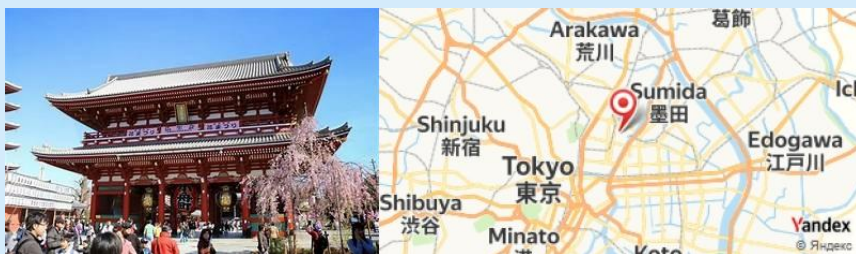
Senso-ji Temple, Tokyo, Japan

- Dirigez-vous vers le quartier traditionnel d'Asakusa pour explorer le temple Senso-ji, le plus ancien de Tokyo. Ne manquez pas le shopping à Nakamise Street, où vous pourrez trouver des souvenirs artisanaux