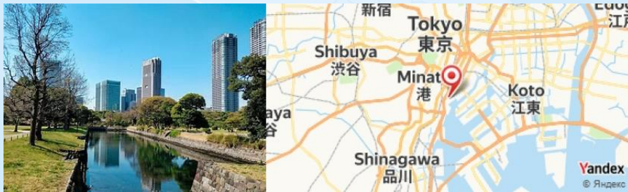
Hamarikyū Gardens, Tokyo, Japan

- Ensuite, visitez le Sanctuaire de Hamarikyū, un jardin traditionnel où vous pourrez vous détendre tout en admirant le paysage japonais classique