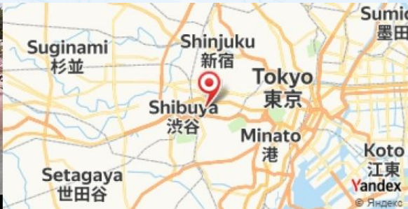
Shinjuku Gyoen National Garden, Tokyo, Japan