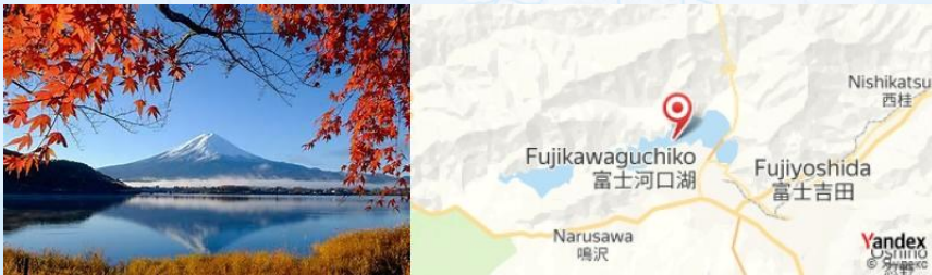
Kawaguchi Lake, Fujikawaguchiko, Japan