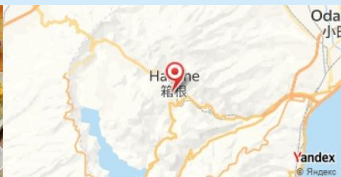
Gora Kadan, Hakone, Japan

- Nuit tranquille dans un ryokan traditionnel pour profiter du calme et de l'expérience japonaise authentique.