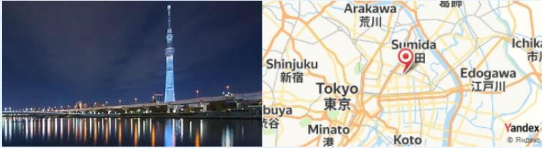
Tokyo Skytree, Tokyo, Japan

- Visite du Tokyo Skytree , la plus haute structure du Japon, pour une vue panoramique incroyable sur la ville. Prenez votre temps pour explorer les boutiques et cafés situés dans le complexe.