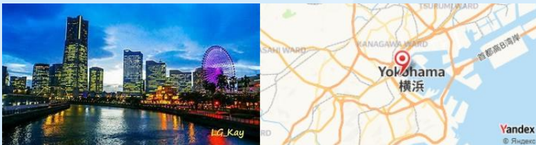
Minato Mirai, Yokohama, Japan

- Terminez par une promenade romantique le long du front de mer de Yokohama Minato Mirai , admirant les lumières nocturnes et l'architecture moderne.