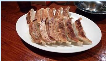
Harajuku Gyoza-ro, Tokyo, Japan

- Déjeuner au Harajuku Gyoza-ro pour déguster des gyozas faits maison.