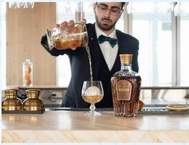
Bar High Five, Tokyo, Japan