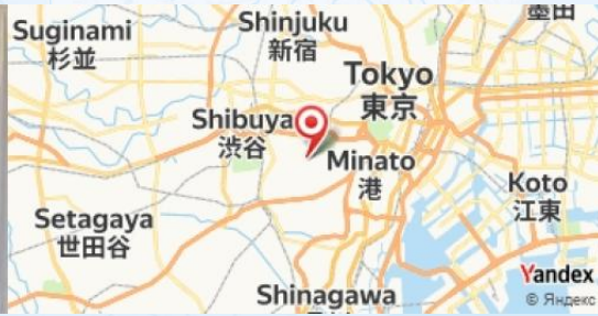
Narisawa, Tokyo, Japan

- Après le dîner, profitez d'une promenade tranquille dans le quartier de Roppongi Hills pour admirer les belles illuminations nocturnes de la ville.