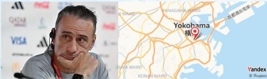
Kantei, Yokohama, Japan