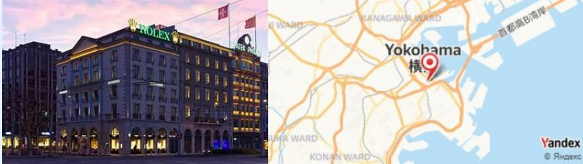
Yokohama Chinatown, Yokohama, Japan

- Explorez Yokohama Chinatown , l'un des plus grands au monde, avec ses boutiques colorées et ses marchés vivants. N'oubliez pas de goûter aux biscuits à la crème de haricot rouge.