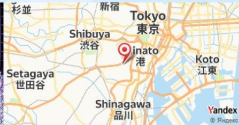
Roppongi Hills, Tokyo, Japan