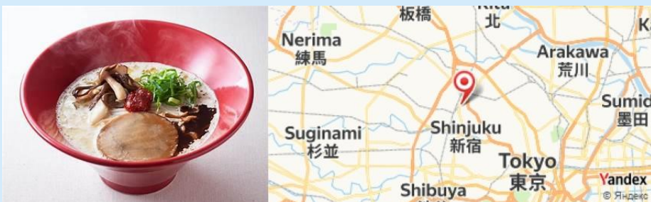
Ippudo, Tokyo, Japan

- Dîner au Ippudo pour savourer un ramen tonkotsu chaud et savoureux. Essayez le gyoza en entrée.