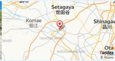
Kiddy Land, Tokyo, Japan