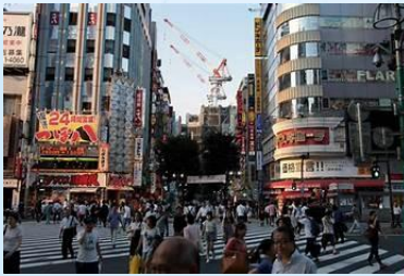
Bills Shinjuku, Tokyo, Japan

- Petit-déjeuner au Bills Shinjuku , célèbre pour ses pancakes ricotta. La terrasse est agréable pour commencer la journée.