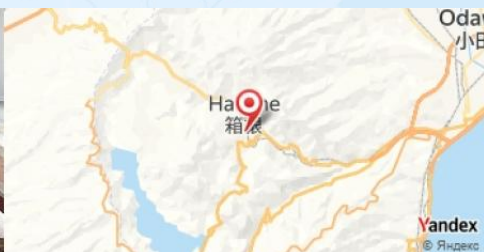
Hakone Open-Air Museum, Hakone, Japan