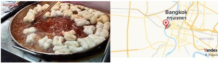
Savoey, Bangkok, Thaïlande

- Soirée détente dans un spa thaïlandais pour un massage relaxant après une journée bien remplie.