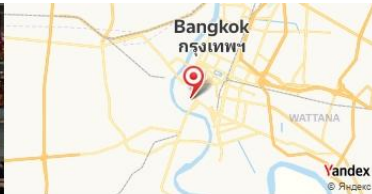
On Lok Yun, Bangkok, Thaïlande