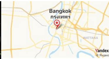
Thip Samai, Bangkok, Thaïlande

- Balade sur la Rivière Chao Phraya , avec des options de croisière nocturne pour admirer les lumières de la ville.