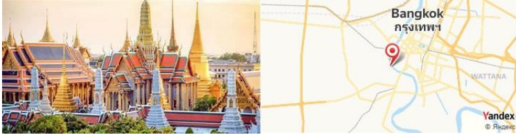
Wat Arun, Bangkok, Thaïlande