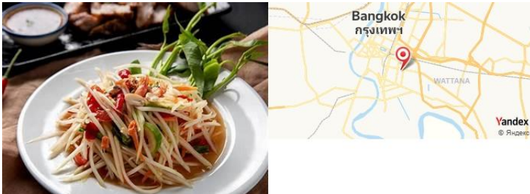
Som Tam Nua, Bangkok, Thaïlande