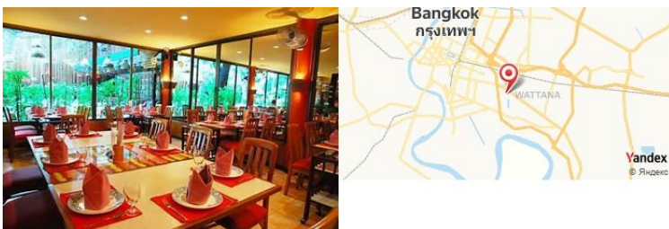
Cabbages & Condoms, Bangkok, Thaïlande