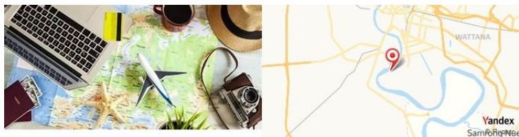
Asiatique The Riverfront, Bangkok, Thaïlande

- Terminez votre voyage par une promenade relaxante à Asiatique The Riverfront , un marché nocturne au bord de l'eau.