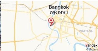
Wat Pho, Bangkok, Thaïlande