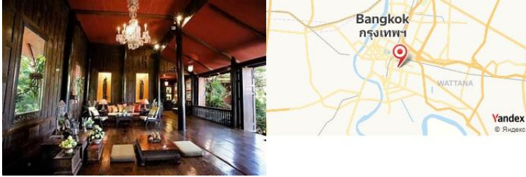
Musée Jim Thompson, Bangkok, Thaïlande