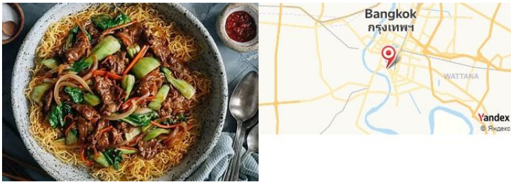
Ba Mee, Bangkok, Thaïlande