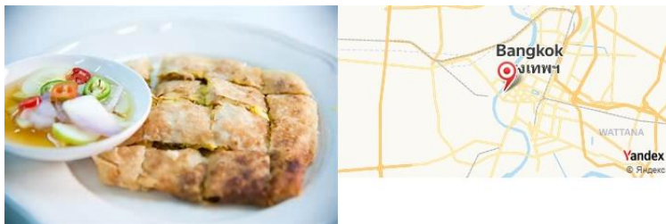
Roti Mataba, Bangkok, Thaïlande

- Déjeuner au Roti Mataba , célèbre pour ses roti thaï.