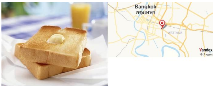
Café Tartine, Bangkok, Thaïlande

- Petit-déjeuner au Café Tartine pour déguster une délicieuse viennoiserie et du café.