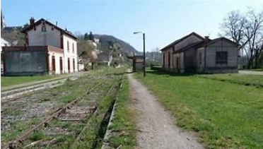
Château de Fumel, Fumel, France

- Visite du Château de Fumel, un site historique qui offre une belle vue sur la vallée du Lot et des explications sur l'histoire locale.