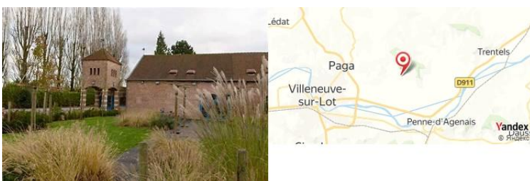
La Grange, Villeneuve-sur-Lot, France

- Dîner à La Grange, restaurant charmant avec une carte variée et des plats locaux.