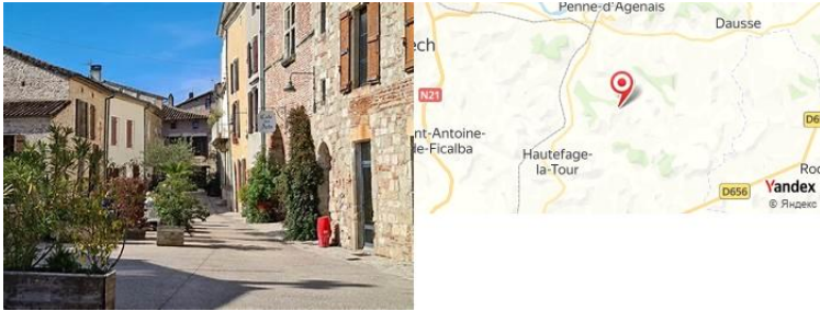
Château de Penne d'Agenais, Penne d'Agenais, France

- Visite du château de Penne d'Agenais, offrant une vue spectaculaire sur la vallée et des activités pour les enfants.