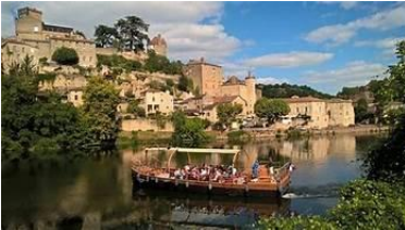
Le Relais, Fumel, France

- Déjeuner au restaurant Le Relais, connu pour sa cuisine régionale comprenant des spécialités de canard.